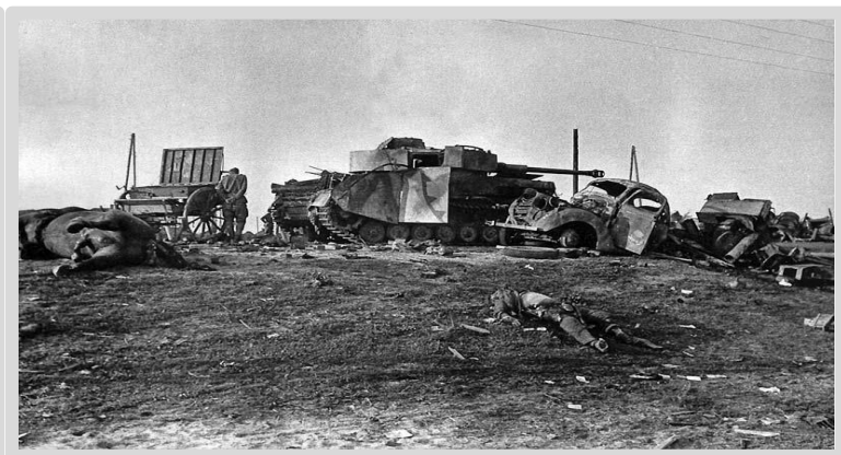
Колонна немецкой техники, уничтоженная по Бобруйском.