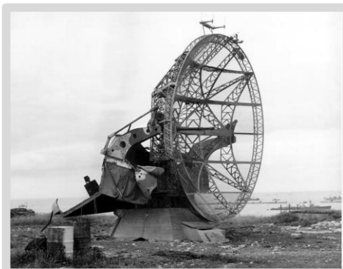
Захваченный в Нормандии немецкий радар.