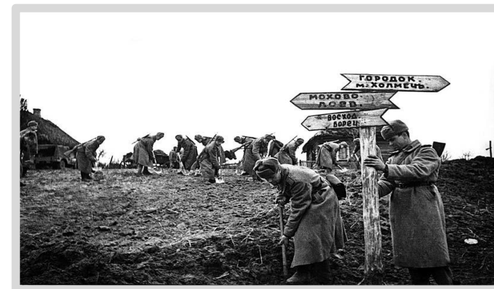
Красноармейцы в освобожденной деревне выравнивают дорогу.