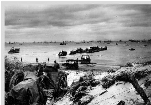
Высадка американских войск в Нормандии.