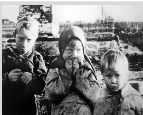
Дети у руин дома в белорусской деревне Лозоватка.