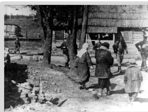
Партизаны и бойцы Красной армии на улице освобожденного Гомеля.