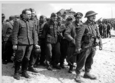
Группа пленных немцев под охраной канадского солдата.